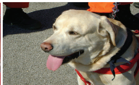
Saygon Morris unità cinofila