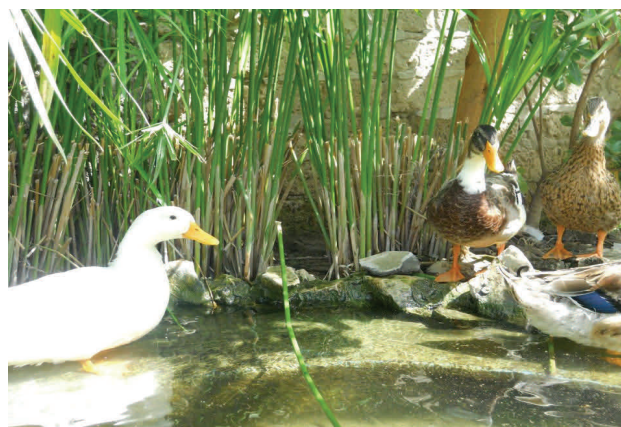
"le nostre mascotte"