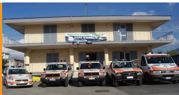
SEDE & MEZZI

L'Associazione Papa Charlie inoltre, periodicamente e secondo le necessità, migliora costantemente il proprio servizio, sia formando i volontari all'utilizzo delle sempre più moderne attrezzature tecniche e logistiche da usare durante le emergenze, sia acquistando queste ultime, grazie al fondamentale contributo delle aziende sostenitrici e dei cittadini.