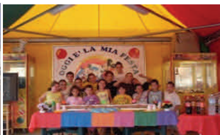
Centro di Aggregazione Giovanile