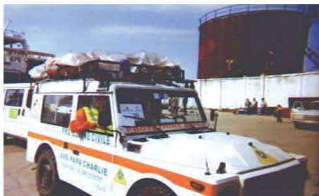
Missione Arcobaleno anno 1999